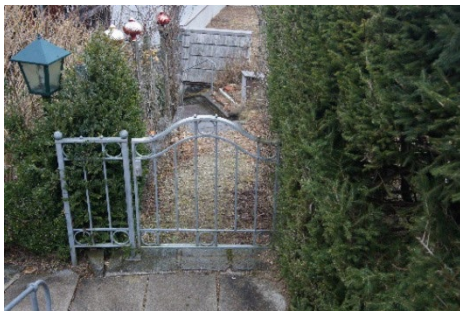
5. Das ist das Zugangstor zur Seevilla