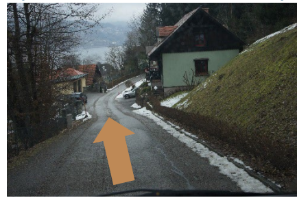
6. Fahren Sie gerade aus