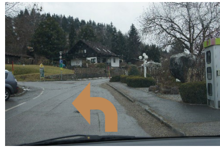
2. Fahren Sie über die Brücke und biegen Sie links ab