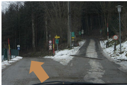
5. Nehmen Sie die linke Spur