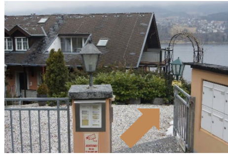
2. Gehen Sie durch das Tor