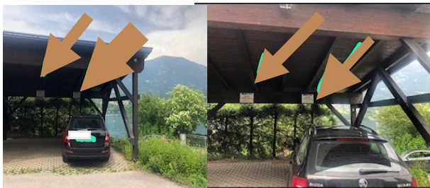
1. te Parkmöglichkeit