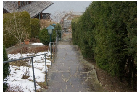
4. Gehen Sie bis ganz nach unten