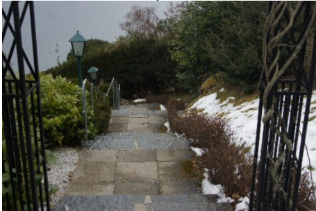
3. Nehmen Sie die Treppen