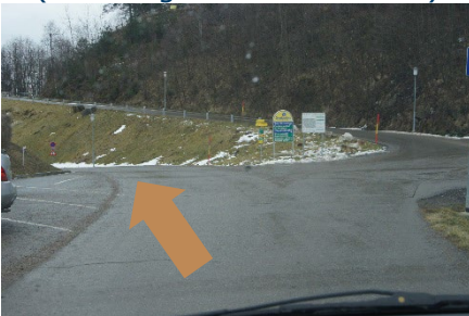
3. Nehmen Sie die linke Spur