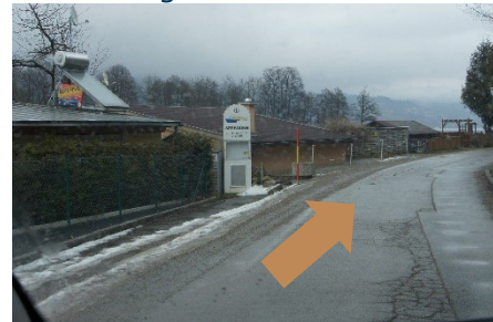
4. Weiter gerade aus (An der Schiffsstation vorbei)