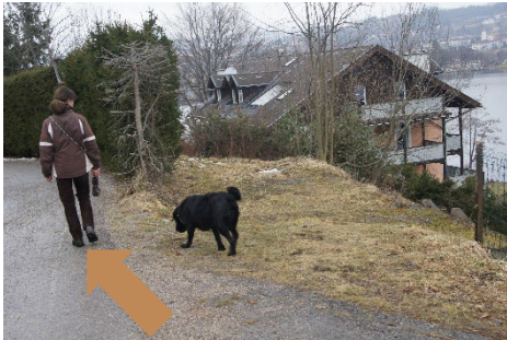
1. Gehen Sie ein paar Meter zurück